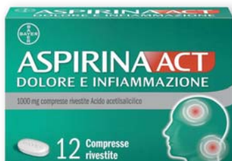
Aspirina Act Dolore e Infiammazione 12 compresse rivestite