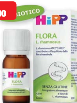
Hipp Flora L. rhamnosus gocce 6,5 ml. Integratore alimentare a base di L. rhamnosus