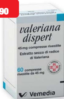
Melatonina Dispert 60 compresse da 45 mg