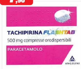
Tachipirina Flashtab 500 mg 16 compresse orodispersibili