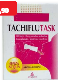
Tachiflutask 10 bustine granulato aroma limone