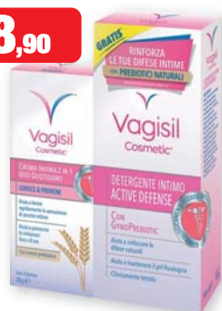
Vagisil Duo Defense Crema intima 2-in-1 30 g + Detergente intimo Active Defense 250 ml