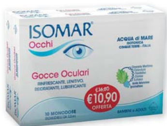
Isomar Occhi Bipack gocce oculari monodoso 10+10 flaconi richiudibili da 0,5 ml. Rinfrescanti, lenitivi, reidratanti, lubrificanti