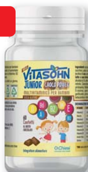
Vitasohn Junior Choco Power 60 confetti. Integratore alimentare multivitaminico per bambini senza glutine