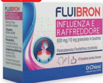
Fluibron Influenza e Raffreddore 10 bustine aroma limone