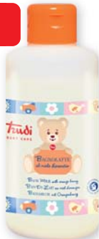
Trudi Baby Care Bagnolatte al miele d'arancio 250 ml