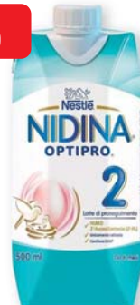
Nidina 2 Optipro latte di proseguimento 500 ml