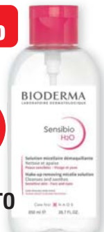
Bioderma Sensibio H2O soluzione micellare struccante 850 ml