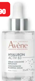
Eau Thermale Avene Hyaluron Activ B3 Siero concentrato rimpolpante antirughe 30 ml