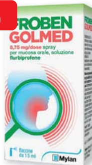
Froben Golmed 8,75 mg/dose spray per mucosa orale 15 ml