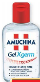
Amuchina Gel Xgerm disinfettante 80 ml

Catalogo n. 75 valido dal 9 gennaio al 26 marzo 2023