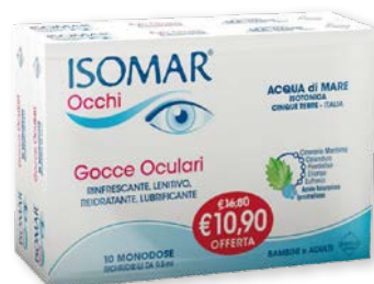
Isomar Occhi Bipack gocce oculari monodose 10+10 flaconi richiudibili da 0,5 ml. Rinfrescanti, lenitive, reidratanti, lubrificanti