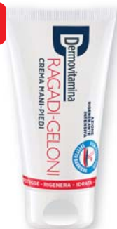
Dermovitamina Ragadi-Geloni crema mani-piedi 75 ml