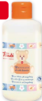
Trudi Baby Care Bagnolatte al miele d'arancio 250 ml