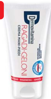
Dermovitamina Ragadi-Geloni crema mani-piedi 75 ml