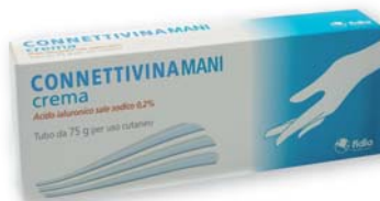
Connettivina mani crema acido ialuronico sale sodico 0,2% 75 g