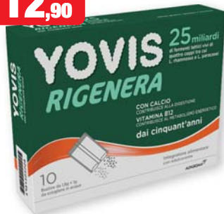
Yovis Rigenera 50+ 10 bustine. 25 miliardi di fermenti lattici vivi di quattro ceppi tra cui L. rhamnosus e L. paracasei