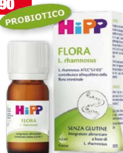
Hipp Flora L. rhamnosus gocce 6,5 ml. Integratore alimentare a base di L. rhamnosus