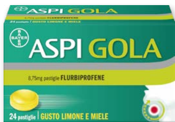
Aspi Gola gusto limone e miele 24 pastiglie