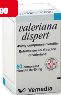
Melatonina Dispert 60 compresse da 45 mg