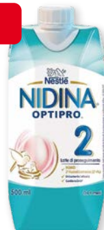
Nidina 2 Optipro latte di proseguimento 500 ml