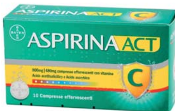
Aspirina Act 800 mg/480 mg 10 compresse effervescenti