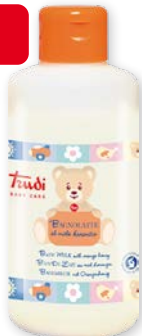
Trudi Baby Care Bagnolatte al miele d'arancio 250 ml