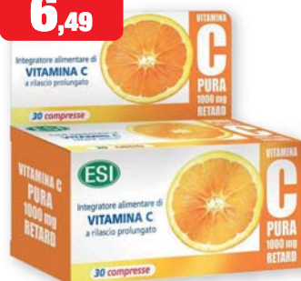
ESI Vitamina C Pura 1000 mg Retard 30 compresse. Integratore alimentare di Vitamina C a rilascio prolungato