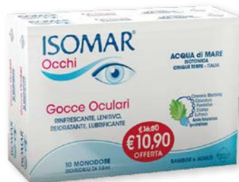
Isomar Occhi Bipack gocce oculari monodose 10+10 flaconi richiudibili da 0,5 ml. Rinfrescanti, lenitive, reidratanti, lubrificanti