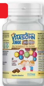
Vitasohn Junior Choco Power 60 confetti. Integratore alimentare multivitaminico per bambini senza glutine