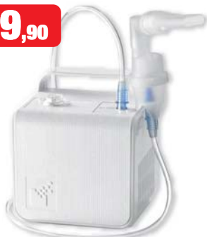
Soffio Cube apparecchio per aerosolterapia leggero e compatto, completo di tutti gli accessori