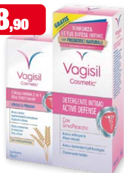
Vagisil Duo Defense Crema intima 2-in-1 30 g + Detergente intimo Active Defense 250 ml