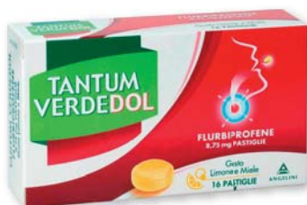
Tantum Verde Dol 16 pastiglie gusto Miele e Limone