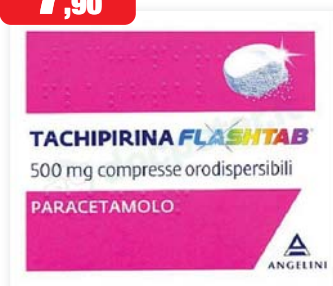
Tachipirina Flashtab 500 mg 16 compresse orodispersibili