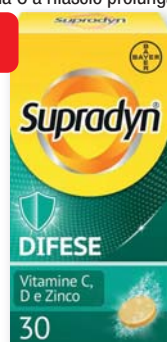
Supradyn Difese 30 compresse effervescenti