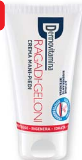
Dermovitamina Ragadi-Geloni crema mani-piedi 75 ml