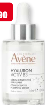
Eau Thermale Avène Hyaluron Activ B3 Siero concentrato rimpolpante antirughe 30 ml