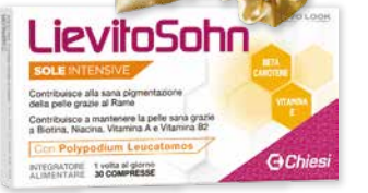
LievitoSohn Sole Intensive 30 compresse integratore alimentare con Beta Carotene, Rame, Biotina, Niacina, Vitamina A e B2