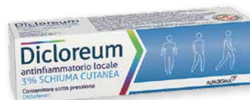
Dicloream antinfiammatorio locale 3% schiuma cutanea 50 g