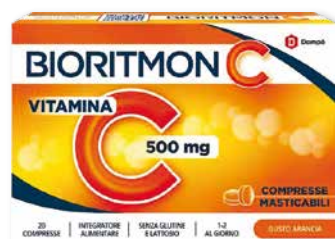
Bioritmon C 500 mg 20 compresse integratore alimentare di Vitamina C