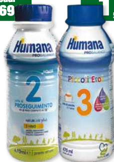
Humana 2 Latte di proseguimento liquido 470 ml Humana 3 Latte di crescita liquido 470 ml