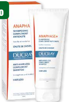
Ducray Anaphase+ Shampoo anti-caduta fortificante 250 ml