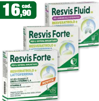
Resvis Fluid XR 12 bst • Resvis Forte XR 12 bst e 12 cpr effervescenti - integratori alimentari per il benessere delle vie respiratorie e per il sistema immunitario