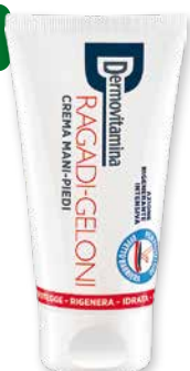
Dermovitamina Ragadi-Geloni crema mani-piedi 75 ml