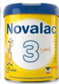
Novalac 2 Latte di proseguimento in polvere 6-12 mesi 800 g • Novalac 3 Latte di crescita in polvere 1-3 anni 800 g

Numero Verde Eufarma 800-910-610 GRATIS ANCHE DAI CELLULARI www.eufarma.eu facebook: eufarma