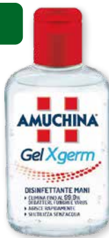
Amuchina Gel Xgerm disinfettante 80 ml