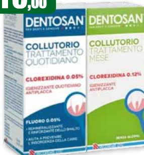
Dentosan collutorio bipack 200+200 ml Clorexidina 0,05% e Clorexidina 0,12