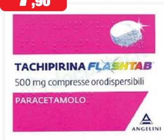
Tachipirina Flashtab 500 mg 16 compresse orodispersibili