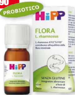
Hipp Flora L. rhamnosus gocce 6,5 ml. Integratore alimentare a base di L. rhamnosus