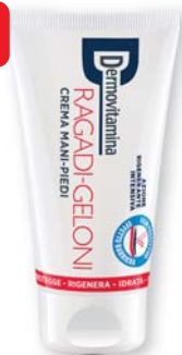
Dermovitamina Ragadi-Geloni crema mani-piedi 75 ml