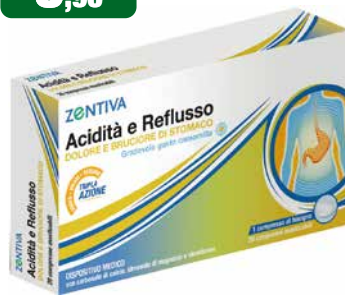
Zentiva Acidità e Reflusso 20 compresse dolore e bruciore di stomaco