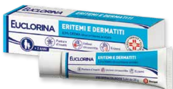
Euclorina Eritemi e Dermatiti 20 g crema per punture d'insetti, Ustioni circoscritte ed Eczemi