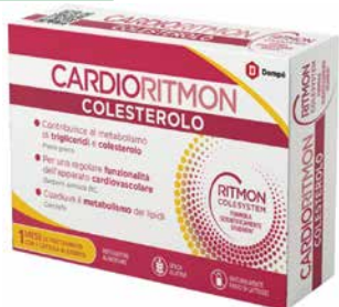
Cardioritmon Colesterolo 30 capsule integratore alimentare