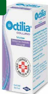
Octilia collirio soluzione 10 ml