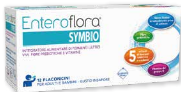
Enteroflora Symbio 12 flaconcini integratore di fermenti lattici vivi, fibre prebiotiche e Vitamine