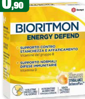
Bioritmon Energy Defend 14 bustine orosolubili integratore alimentare di Vitamine del gruppo B, Vitamina D, Probiotici