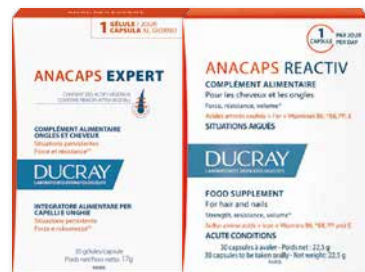
Anacaps Expert (situazione persistente) 30 cps Anacaps Reactiv (situazione occasionale) 30 cps integratori alimentari per capelli e unghie

Numero Verde Eufarma 800-910-610 GRATIS ANCHE DAI CELLULARI www.eufarma.eu facebook: eufarma