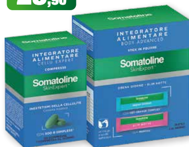
Somatoline SkinExpert Integratori: Cellu Expert 30 compresse trattamento intensivo Body Advanced 28 bustine da sciogliere in acqua