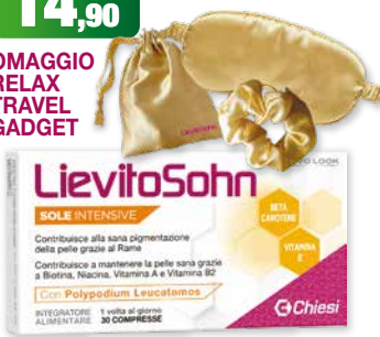
LievitoSohn Sole Intensive 30 compresse integratore alimentare con Beta Carotene, Rame, Biotina, Niacina, Vitamina A e B2