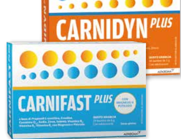
Carnidyn Plus e Carnifast Plus integratori alimentari 20 bustine