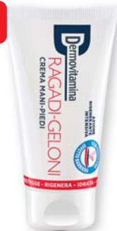
Dermovitamina Ragadi-Geloni crema mani-piedi 75 ml