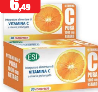
ESI Vitamina C Pura 1000 mg Retard 30 compresse. Integratore alimentare di Vitamina C a rilascio prolungato