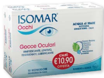
Isomar Occhi Bipack gocce oculari monodose 10+10 flaconi richiudibili da 0,5 ml. Rinfrescanti, lenitive, reidratanti, lubrificanti