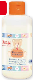
Trudi Baby Care Bagnolatte al miele d'arancio 250 ml