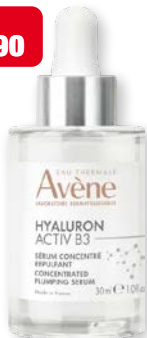
Eau Thermale Avene Hyaluron Activ B3 Siero concentrato rimpolpante antirughe 30 ml