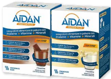
Aidan Protein Plus 7 bustine integratore alimentare in polvere con Proteine, Vitamine, Minerali. Gusti Cioccolato e Vaniglia