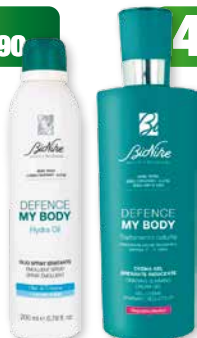
Bionike Defence My Body: Olio spray idratante 200 ml Crema-gel drenante riducente 400 ml