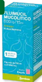
Fluimucil Mucolitico 600 mg/15 ml sciroppo 200 ml