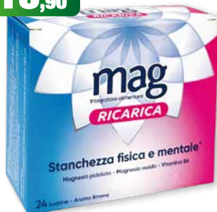
Mag Ricarica 24 bustine integratore alimentare di Magnesio pidolato, Magnesio ossido, Vitamina B6