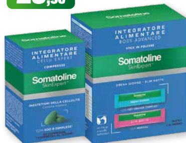
Somatoline SkinExpert Integratori: Cellu Expert 30 compresse trattamento intensivo Body Advanced 28 bustine da sciogliere in acqua