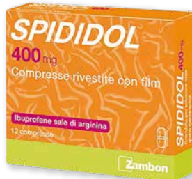
Spididol 400 mg 12 compresse rivestite