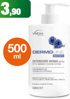
Vebix DermoLine detergente intimo 500 ml Varie fragranze: Calendula, Fiordaliso, Melograno