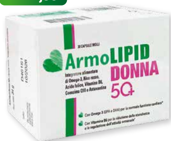
ArmoLipid Donna 50+ 30 capsule molli integratore alimentare di Omega-3, Riso rosso, Acido folico, Vitamina B6, Coenzima Q10 e Astaxantina