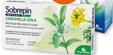
Sobrepin Natura Caramelle Gola 20 pastiglie OMAGGIO Sobrepin Gola spray 20 ml