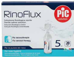
Rinoflux soluzione fisiologica sterile 20 flaconcini da 5 ml