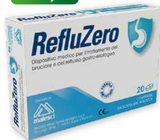
RefluZero 20 compresse da sciogliere in bocca per il trattamento del bruciore e del reflusso gastro-esofageo