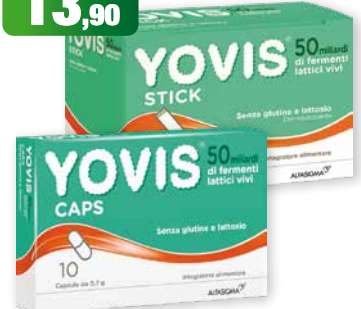
Yovis Stick 10 bustine orosolubili Yovis Caps 10 capsule 50 miliardi di fermenti lattici vivi