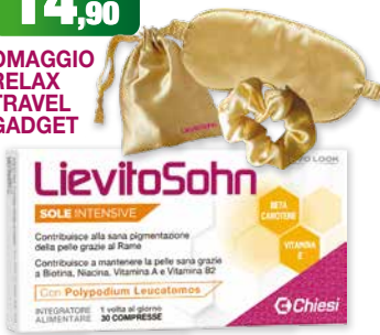
LievitoSohn Sole Intensive 30 compresse integratore alimentare con Beta Carotene, Rame, Biotina, Niacina, Vitamina A e B2