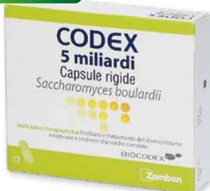
Codex 5 miliardi 12 capsule rigide blister. Fermenti lattici Saccharomyces boulardii