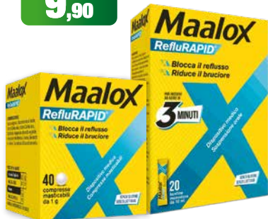
Maalox RefluRapid 40 compresse masticabili - 20 bustine blocca il reflusso, riduce il bruciore