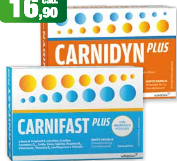
Carnidyn Plus e Carnifast Plus integratori alimentari 20 bustine