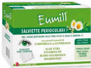
Eumill 20 salviette perioculari per l'igiene della zona degli occhi