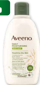
Aveeno Bagno doccia 300 ml