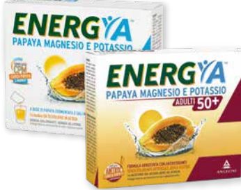
Energya Papaya Magnesio e Potassio Energya Papaya Magnesio e Potassio Adulti 50+ 14 bustine a base di Papaya fermentata e Sali minerali