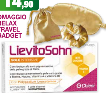
LievitSohn Sole Intensive 30 compresse integratore alimentare con Beta Carotene, Rame, Biotina, Niacina, Vitamina A e B2