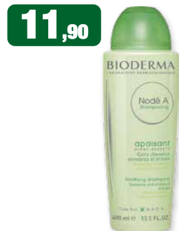
11,90 BIODERMA Nodé A Shampooing opoponi per pelli irritate e sensibili Crema idratante con Vitamine B5 e B6 400 ml e - 13.3 FL. OZ. Bioderma Nodé A Shampooing 400 ml. Shampoo lenitivo adatto al cuoio capelluto irritato e sensibile