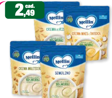
2,49 cad. Mellin CREMA DI RISO CREMA DI MAIS E TAPIOCA CREMA MULTICEREALI SEMOLINO Mellin Crema di Riso, Crema Mais e Tapioca, Crema Multicereali, Semolino 200 g

Numero Verde Eufarma 800-910-610 GRATIS ANCHE DAI CELLULARI www.eufarma.eu facebook: eufarma