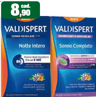
8,90 cad. VALDISPERT SONNO REGOLARE Notte Intera Rilascio degli ingredienti fino a 8 ORE 8h Rilascio prolungato Valdispert: Valproato di Sodio e Clonazepam Valdispert: Valproato di Sodio e Clonazepam Valdispert: Valproato di Sodio e Clonazepam Valdispert: Valproato di Sodio e Clonazepam Valdispert Notte Intera e Sonno regolare 30 compresse a rilascio prolungato