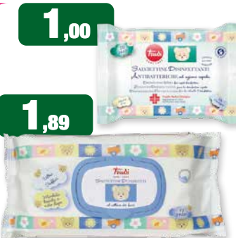
1,00 cad. Trudi SALVIETTE DISINFETTANTI ANTIBATTERICHE ad azione rapida SALVIETTE DETERGENTI per il cambio 1,89 Trudi SALVIETTE DETERGENTI per il cambio Trudi Baby Care 20 salviette disinfettanti antibatteriche 72 salviette detergenti per il cambio