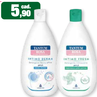
5,90 cad. TANTUM ROSA INTIMO DERMA Detergente Intimo a pH 4,5 INTIMO FRESH Detergente Intimo a pH 4,5 500 ml Tantum Rosa Intimo Derma e Intimo Fresh 500 ml pH 4,5