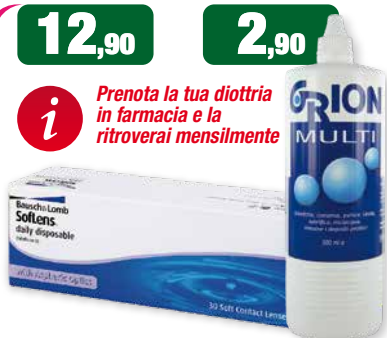
12,90 2,90 Bausch & Lomb Soflens daily disposable 30 Soft Contact Lenses ORION MULTI Soluzione univita 500 ml i Prenota la tua diottria in farmacia e la ritroverai mensilmente Bausch & Lomb lenti a contatto Soflens giornaliere day disposable 30 pz Orion Multi soluzione unica 500 ml