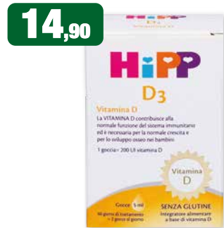
14,90 HiPP D3 Vitamina D La VITAMINA D contribuisce alla normale funzione del sistema immunitario ed è necessaria per la normale crescita e per lo sviluppo osseo nei bambini. 1 goccia = 200 UI vitamina D Senza glutine Integratore alimentare a base di vitamina D 5 goccie (5 ml) Hipp D3 goccie 5 ml integratore alimentare a base di Vitamina D