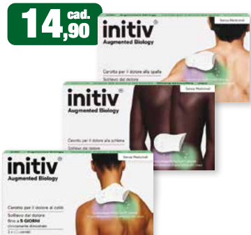
14,90 cad. initiv Augmented Biology Cerotto per il dolore alla testa Cerotto per il dolore alla schiena Cerotto per il dolore al collo Cerotto per il dolore al collo Soluzione del dolore fino a 5 GIORNI Concentrato analgesico a 2 componenti Initiv Augmented Biology 3 cerotti per il dolore Spalla - Schiena - Collo sollievo dal dolore fino a 5 giorni