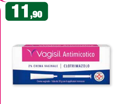
11,90 Vagisil Antimicotico 2% CREMA VAGINALE | CLOTRIMAZOLO Crema vaginale - tubo da 30 con applicatore intravaginale Vagisil Antimicotico 2% crema vaginale 30 g